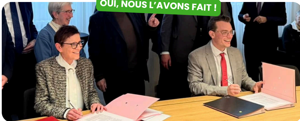
Signature d'un bail à construction pour le projet d'extension de l'Institut Notre-Dame de la Providence